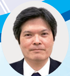
東京大学医科学研究所 教授 武川 睦寛