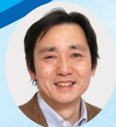
東京大学医科学研究所 特命教授 井上純一郎